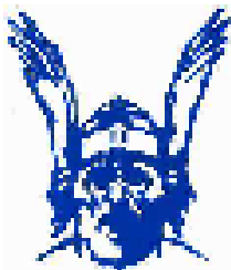
Effer WARRIORS Bologna